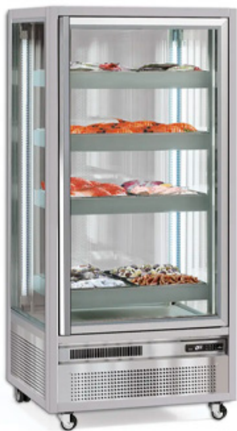
EXPONORM 652 · VUE D'ENSEMBLE

Vitrine verticale spécialement conçue pour l' exposition du poisson frais · 4 faces vitrées · Évaporateurs inox · 8 bassines GN 1/1 h 65 mm taillées