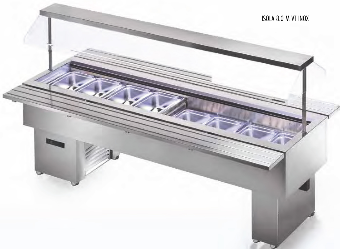
ISOLA 8.0 M VT INOX